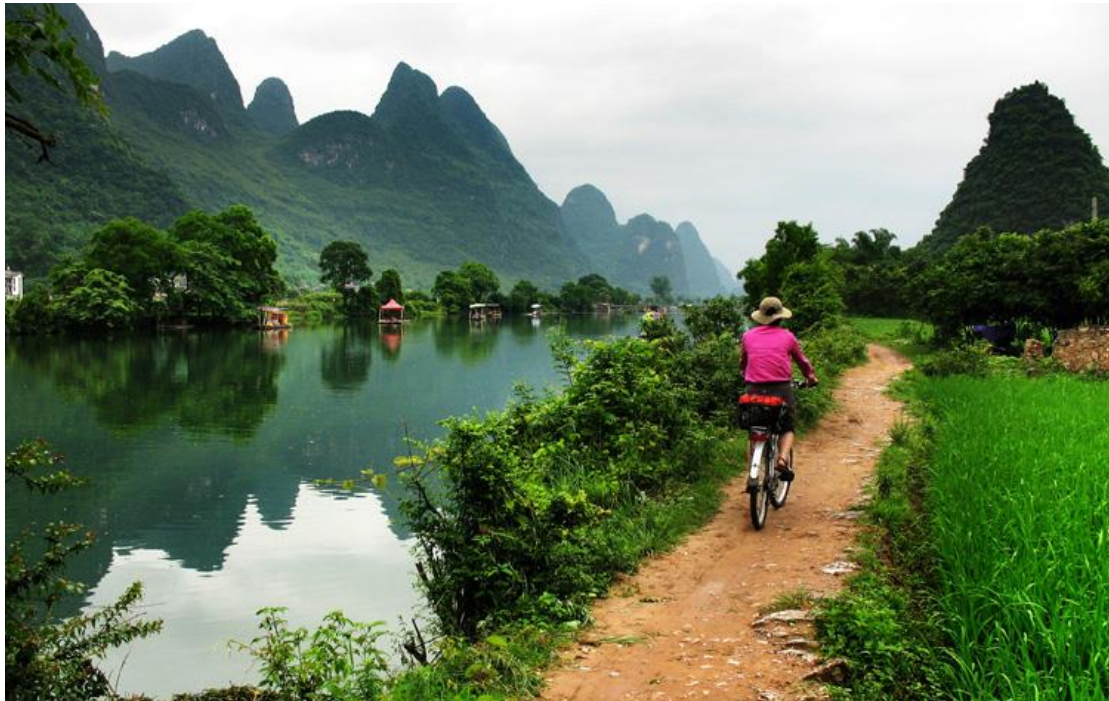
Radfahren durch die Karstkegellandschaft am Li-Fluss

Neben den klassischen Highlights einer Einsteigerreise gewinnen Sie auf dieser Tour intensive Eindrücke, wie sie nur vom Fahrrad aus möglich sind. In den traditionellen Pekinger Hutong Altstadtvierteln bestaunen Sie das ursprüngliche Leben. Auf der breiten und fahrradfreundlichen Stadtmauer in der alten Kaiserstadt Xi'an radeln Sie einmal rund um die Innenstadt. Südchina erwartet Sie mit zauberhaften Bergen im Gebiet um den Li-Fluss und während andere Touristen eine lange und unflexible Bootsfahrt machen, erkunden Sie das Gebiet mit dem Fahrrad. So entdecken Sie wunder- volle Orte und Landschaften abseits der Massen. Zum Abschluss der Reise besichtigen Sie die Megametropole Hongkong – natürlich ganz flexibel auf zwei Rädern!