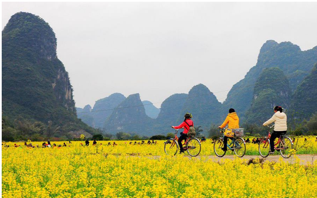
Radfahrt von Caoping nach Xingping

Radtour: ca. 36 km / ca. 4 Std. mit Steigung