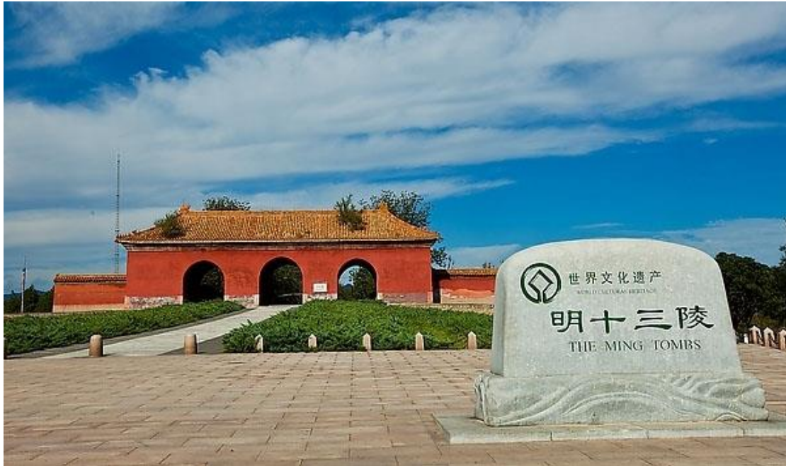
Gräbern der Ming Kaiser